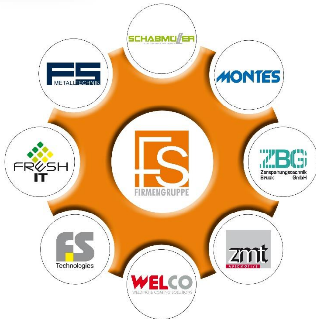
Die Tochtergesellschaften der FRAMOS Holding GmbH