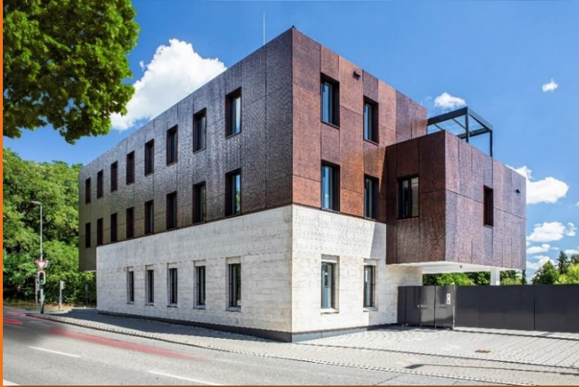
Seit 2018 ist der Ludwigsgarten die Firmenzentrale der Franz Schabmüller Firmengruppe.