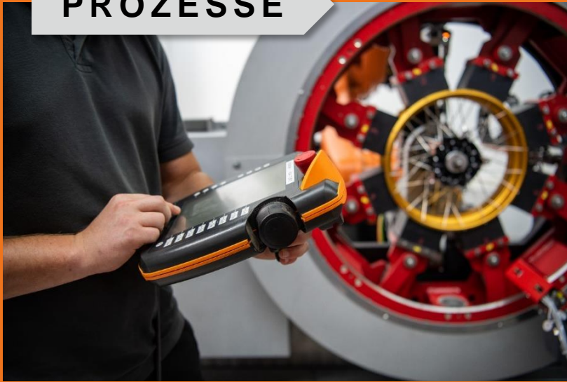
Prozessprogrammierung zur Qualitätssicherstellung.

PROZESSE stellen ein bedeutendes Feld unserer Nachhaltigkeitsstrategie und Unternehmenskultur dar.