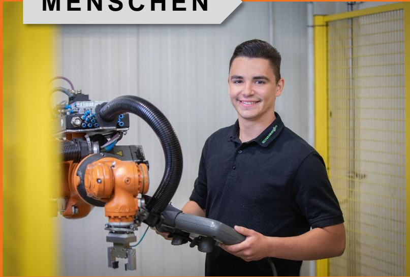
Trotz moderner Anlagen steht der Mensch im Mittelpunkt.

MENSCHEN stellen ein bedeutendes Feld unserer Nachhaltigkeitsstrategie und Unternehmenskultur dar.