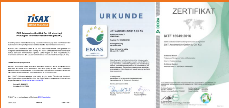
Verankerung von Prozesssicherheit durch anspruchsvolle, regelmäßig auditierte Managementsysteme.