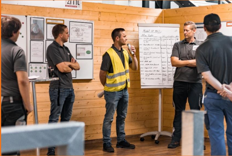
Regelmäßige Austauschrunden in der Fertigung fördern die Prozessoptimierung.